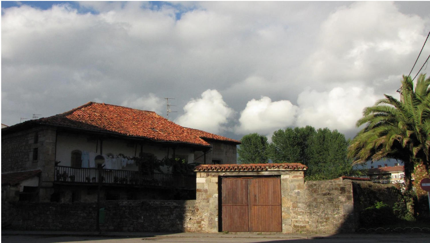
9 - CABEZÓN DE LA SAL 2010 - Casa en La Pesa