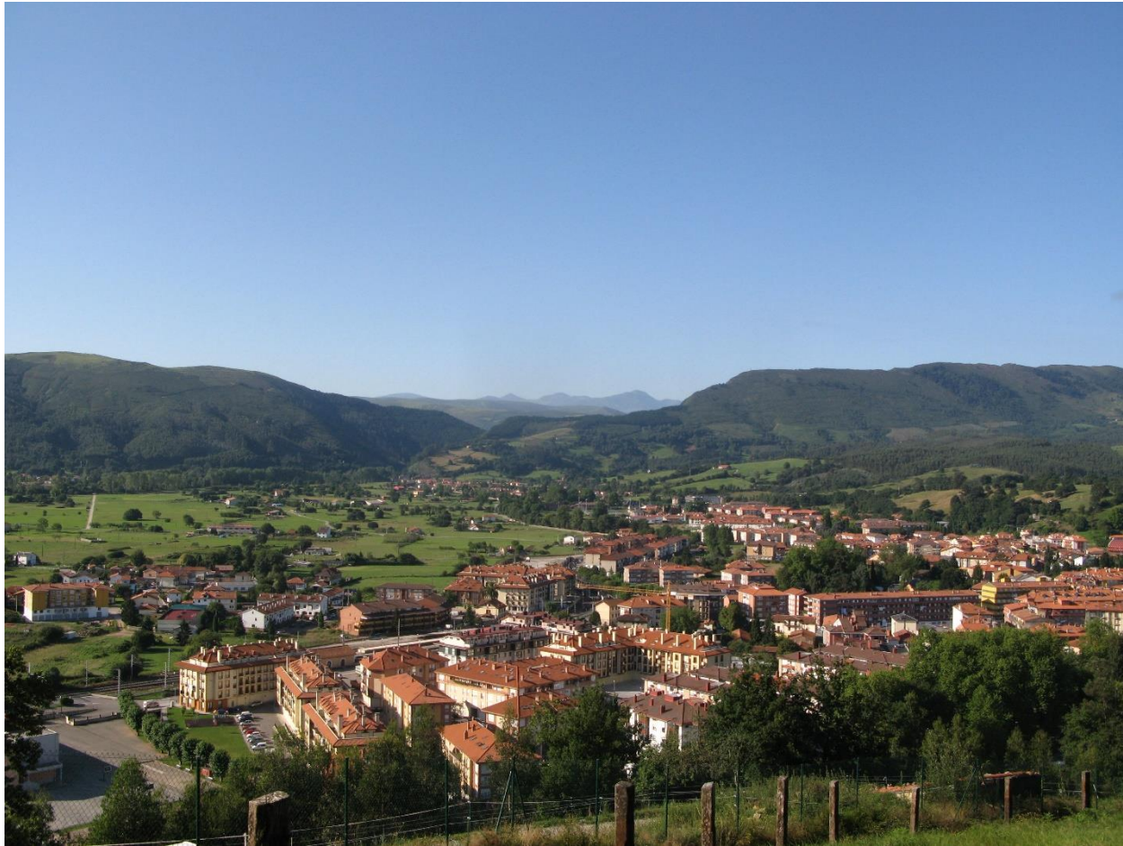
8 - CABEZÓN DE LA SAL 2009 - Vista desde el noreste