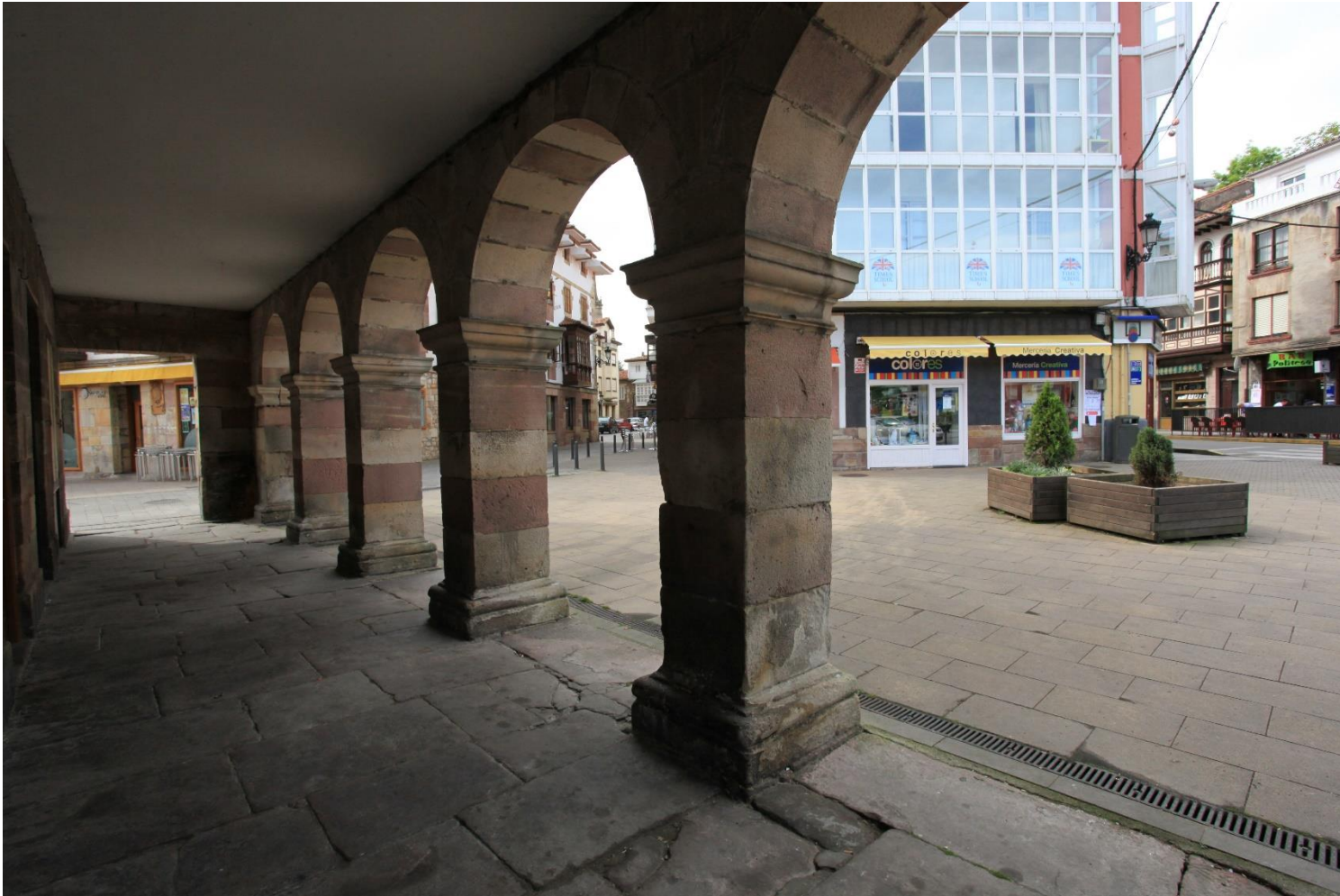
12 - CABEZÓN DE LA SAL 2011 – Desde Los Arcos