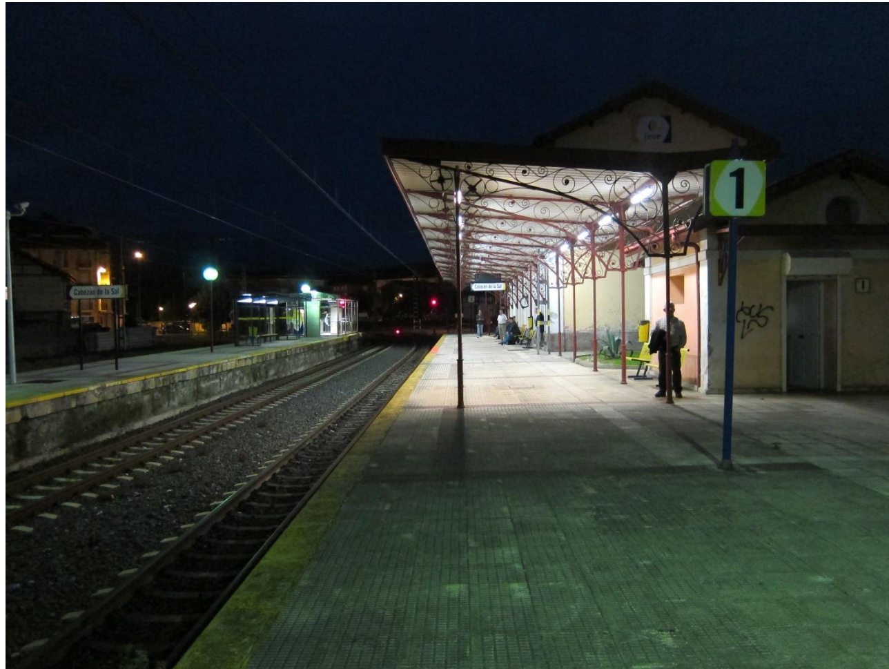
14 - CABEZÓN DE LA SAL 2011 – La Estación