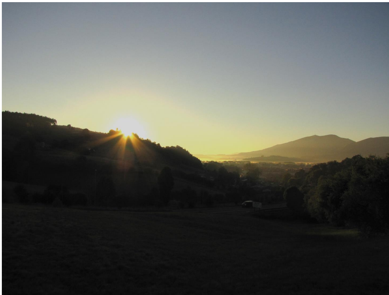
15 – CABEZÓN DE LA SAL 2013 – Amanecer desde Navas