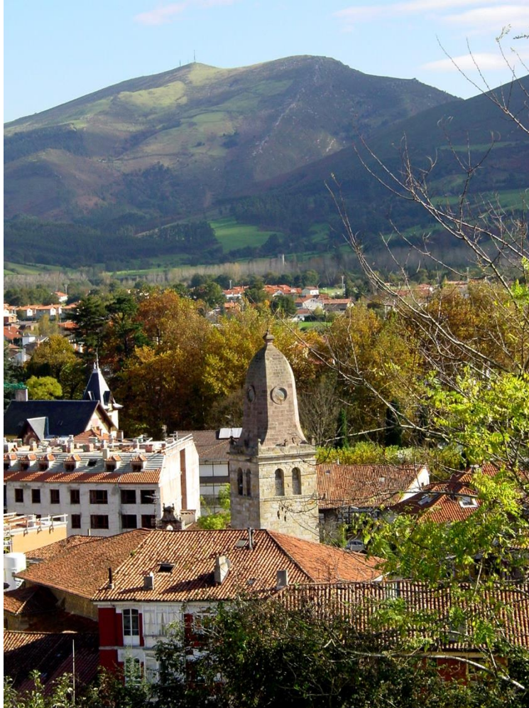
2 - CABEZÓN DE LA SAL 2003 – Picos de la Torres