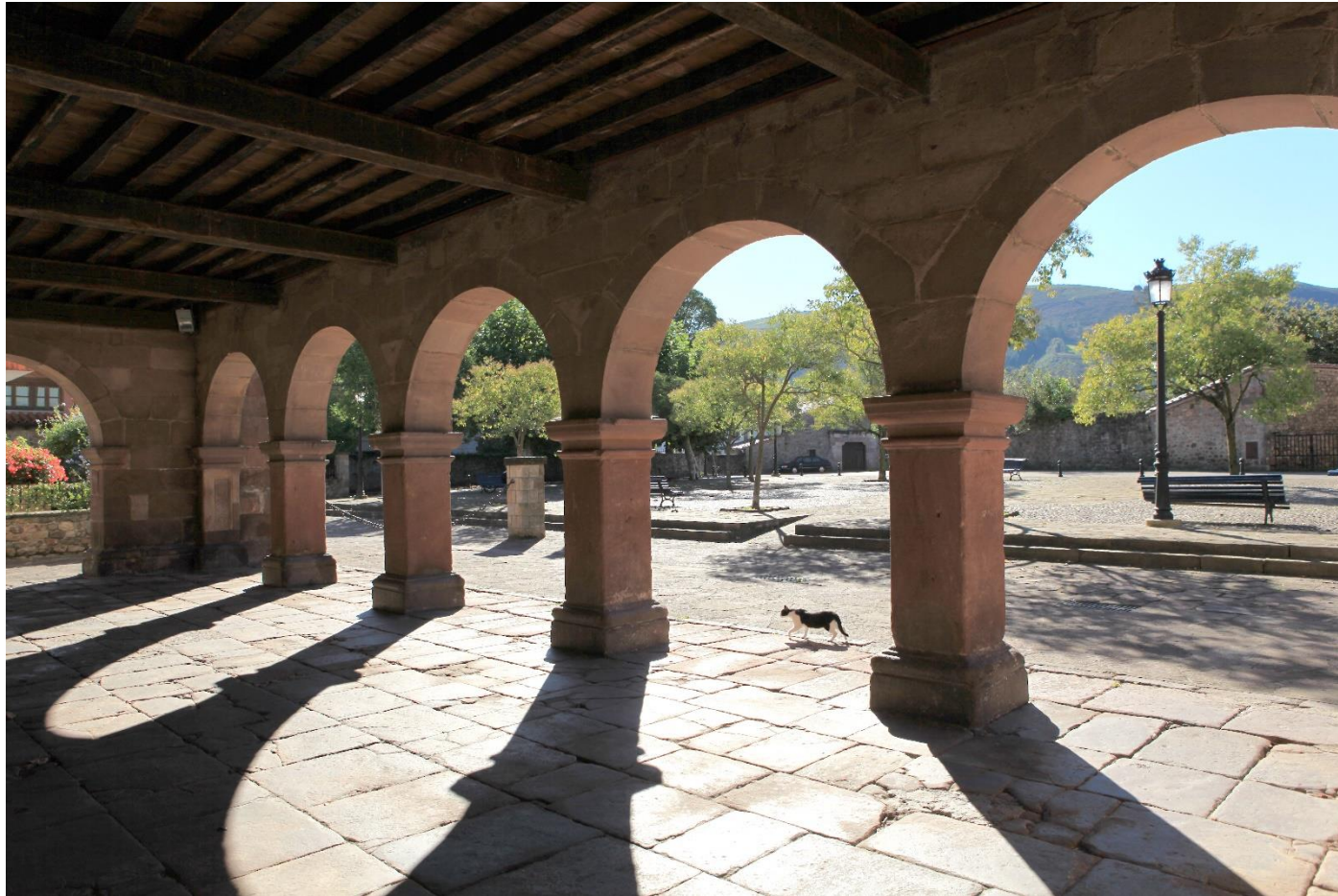
11 - CABEZÓN DE LA SAL 2011 – Museo de la Naturaleza en Carrejo