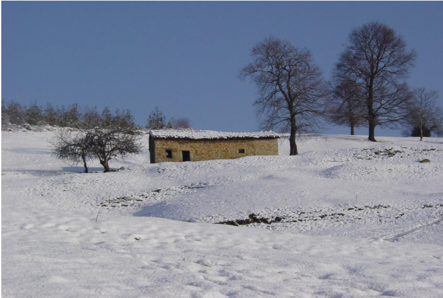
5 - CABEZÓN DE LA SAL 2006 – Invernal con nieve