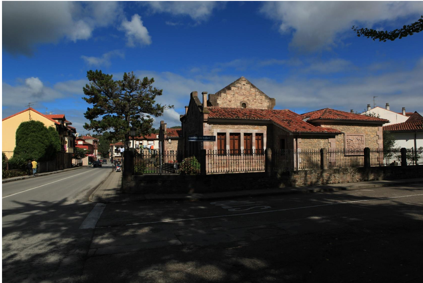
10 - CABEZÓN DE LA SAL 2011 – Antigua Escuela de Comercio