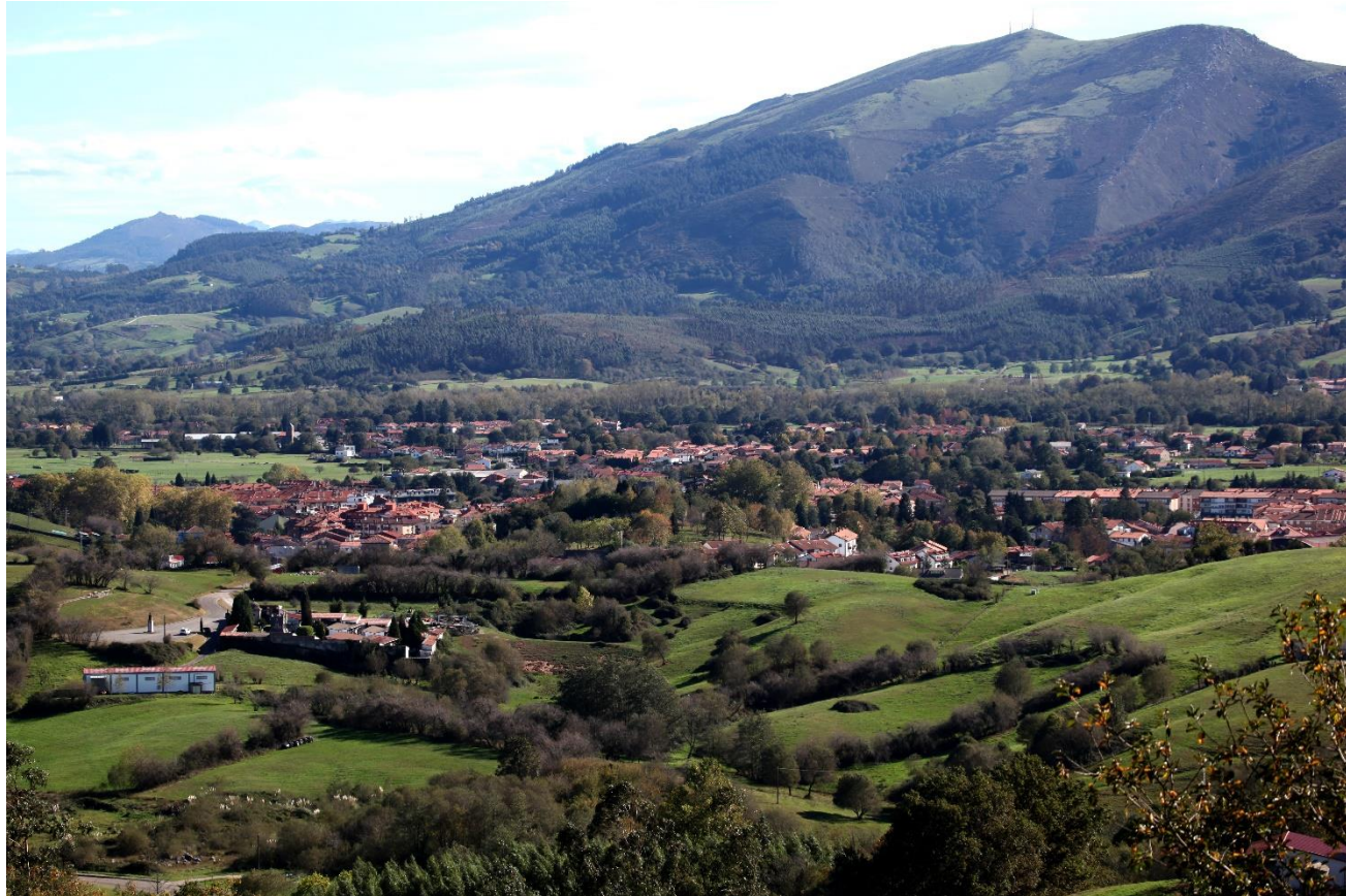
20 - CABEZÓN DE LA SAL 2022 – Vista desde el oeste