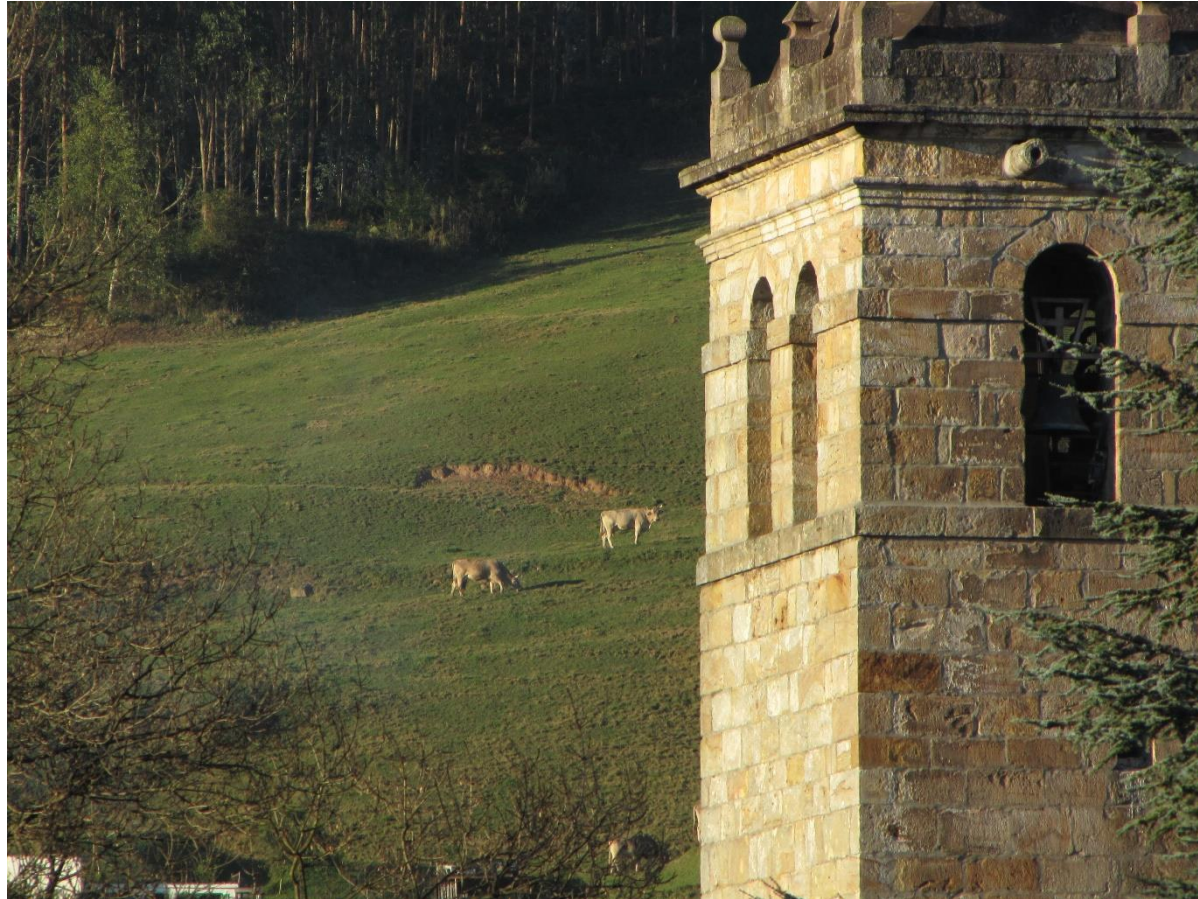
13 - CABEZÓN DE LA SAL 2011 - La cuesta del campanario