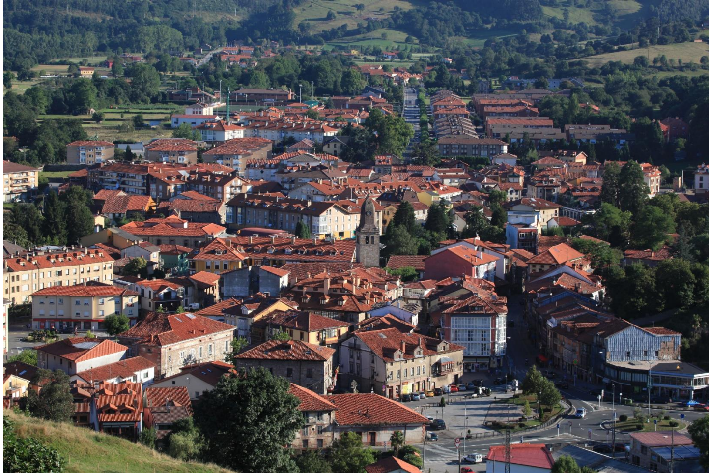
18 - CABEZÓN DE LA SAL 2013 – Vista desde La Mata