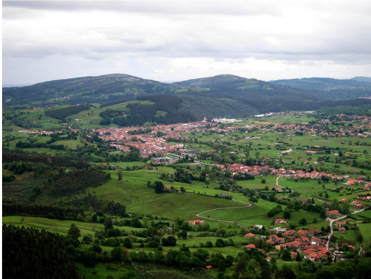
19 - CABEZÓN DE LA SAL 2013 – Vista desde la Sierra del Escudo