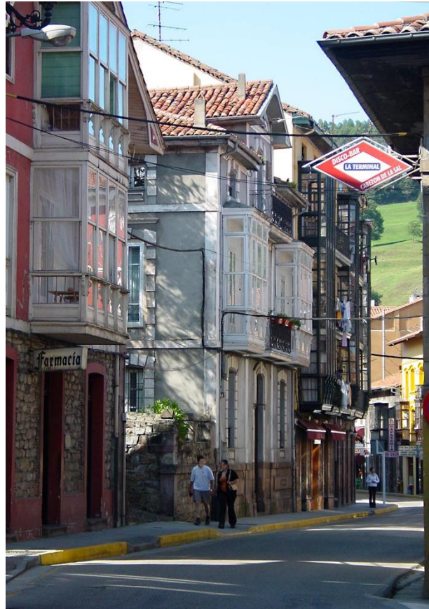
1 - CABEZÓN DE LA SAL 2002 – Galerías en Julio