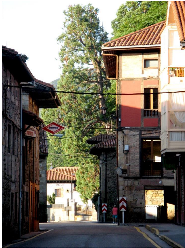
6 - CABEZÓN DE LA SAL 2007 – Luces de Agosto