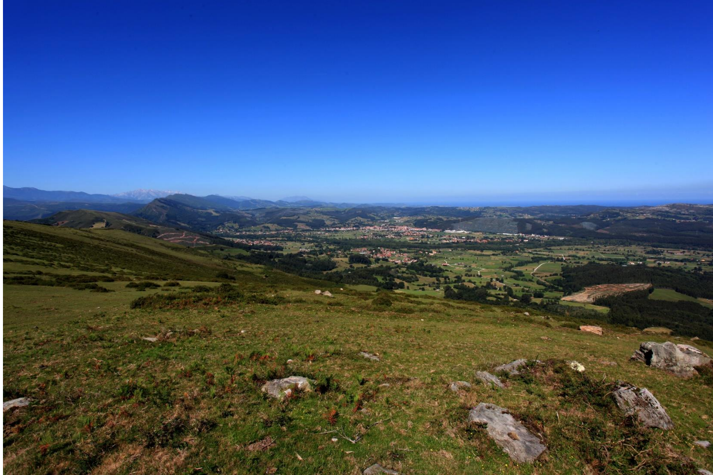
17 - CABEZÓN DE LA SAL 2013 – Vista desde el sureste