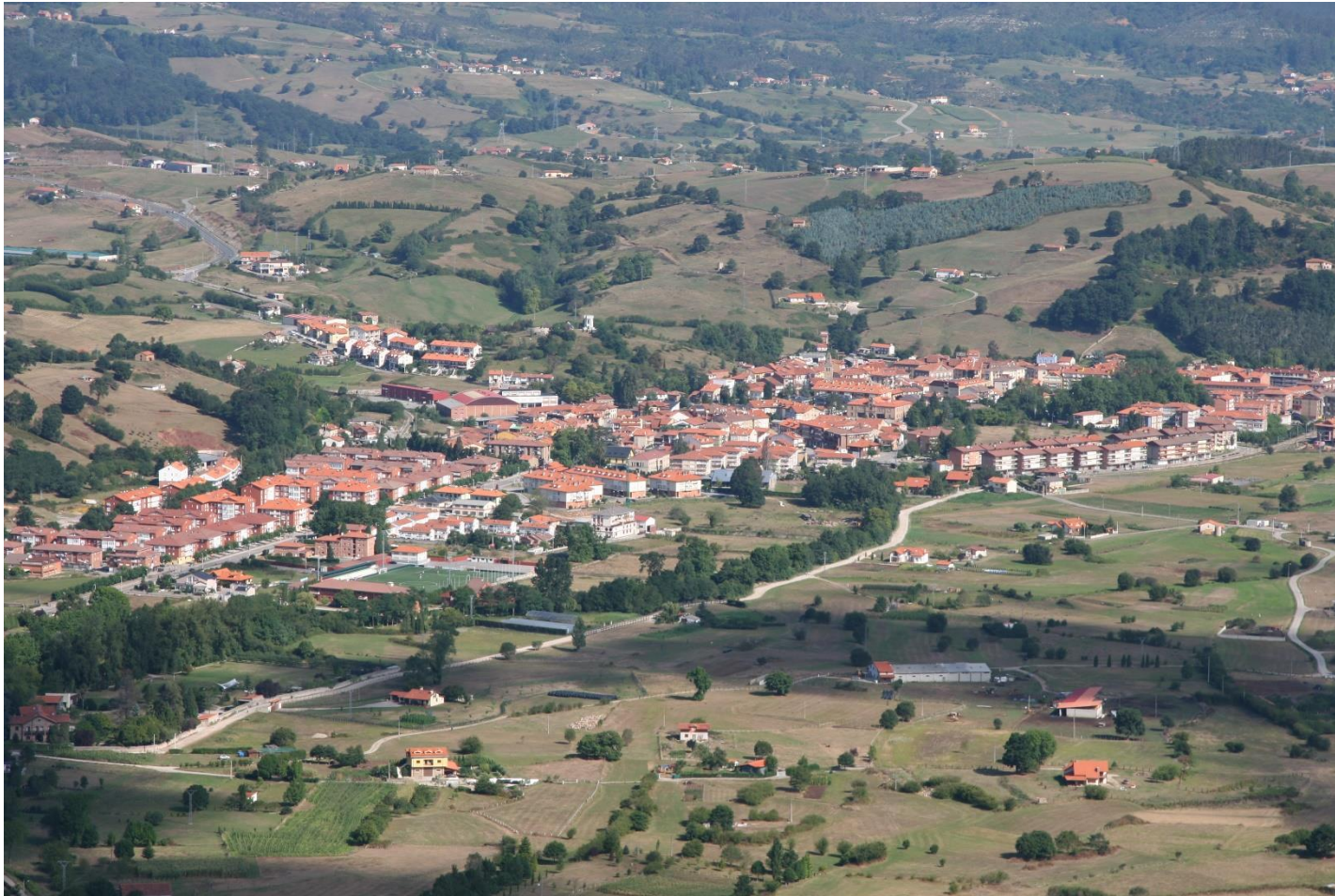
4 - CABEZÓN DE LA SAL 2005 – Vista desde el sur