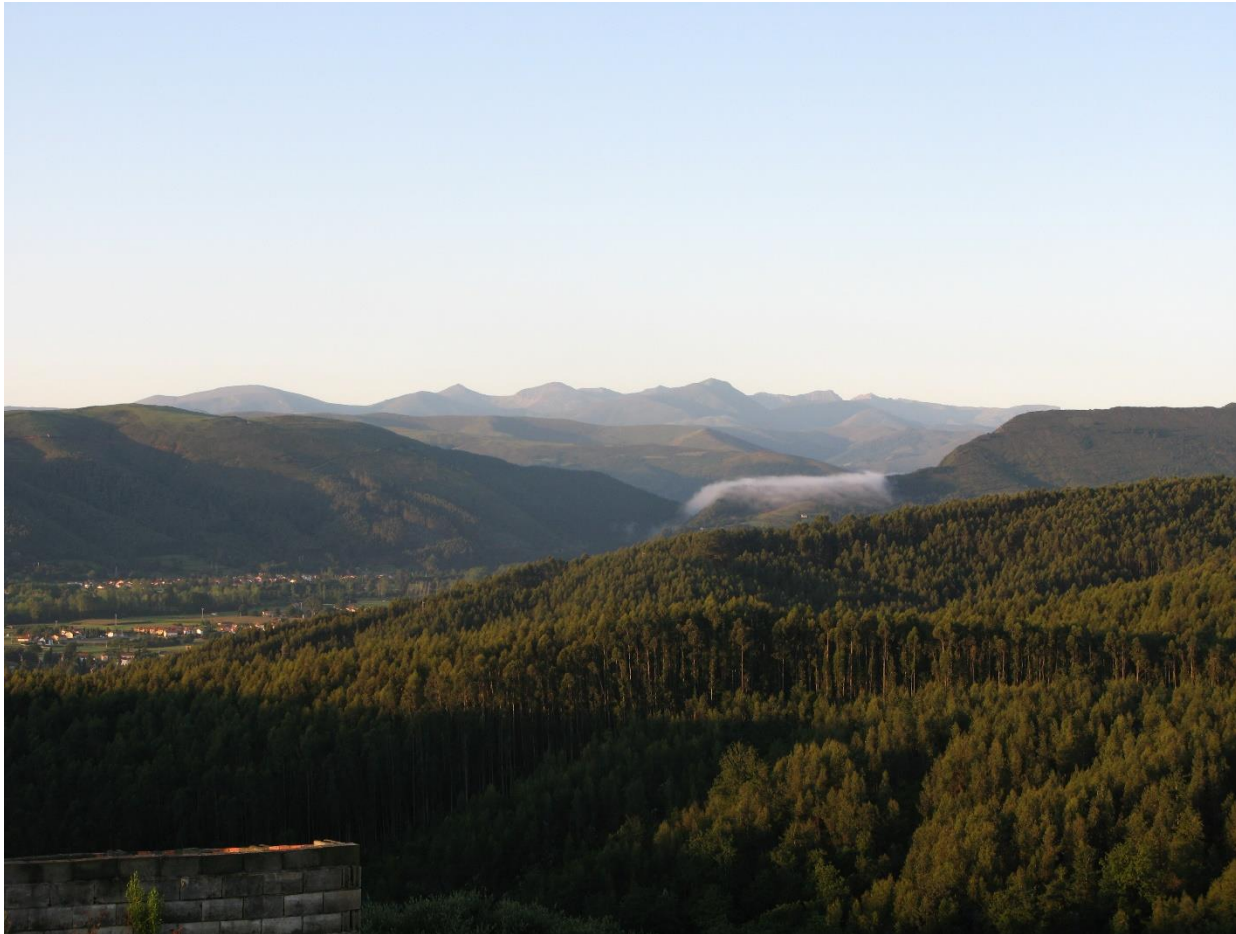
7 - CABEZÓN DE LA SAL 2009 – Vista desde Bustablado