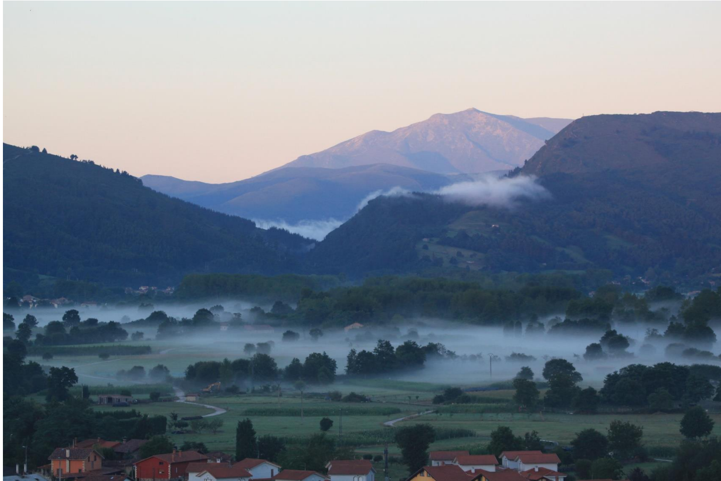
16 - CABEZÓN DE LA SAL 2013– Vista del Valle desde el este